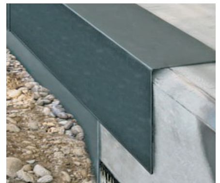
Winkelschutz-Element Wirkungsvoller Kantenschutz