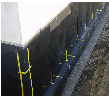
Schutzplatten Für vertikale Abdichtungen vor Hinterfüllung