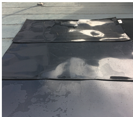
Schutzplatten Schützen horizontale Abdichtungen