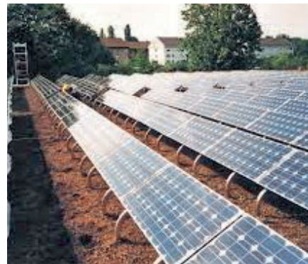
Plaques de base Pour systèmes est-ouest