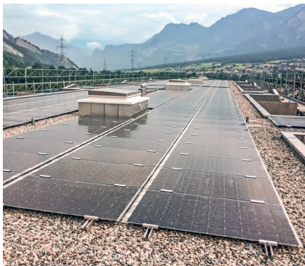
Plaques de base Utilisation pour Est-Ouest et installations plates